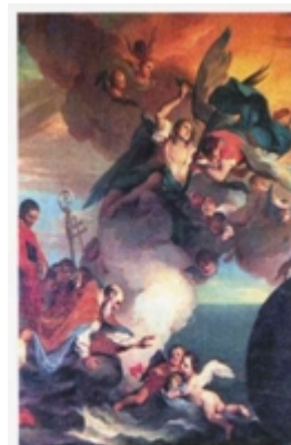
LA TESTA DI S. TORPÈ MARTIRE VIENE RECUPERATA DAL MARE PER MANO DEGLI ANGELI