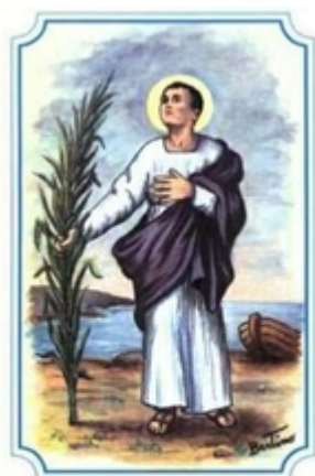
San Torpè di Disa m. 29 APRILE

Sul luogo del martirio, a san Torpè fu eretto in epoca imprecisata un edificio di culto, testimoniato soltanto dal 1084, ove si venerava la reliquia della testa. La chiesetta fu inglobata nel nuovo monastero di San Rossore [vedi San Lussorio (Rossore) martire], in cui il capo fu trasferito. A Torpè fu alla metà del Duecento dedicata una chiesa urbana, posta in prossimità del luogo ove secondo la leggenda il santo avrebbe subito interrogatori e torture, i cosiddetti Bagni di Nerone, avanzi di un impianto termale di età adrianea ancora visibili presso l'odierna Porta a Lucca. Il nuovo edificio sacro, promosso dall'arcivescovo Federico Visconti (1253-1277), fu affidato all'Ordine degli Umiliati. Nel nuovo edificio sacro venne traslata la testa del titolare una volta che il monastero di San Rossore fu abbandonato e qui è ancora conservata, racchiusa dal 1667 in un busto d'argento. L'Ordine degli Umiliati fu soppresso nel 1571: nella chiesa pisana subentrarono nel 1584 i Frati di San Francesco di Paola fino alla soppressione del 1784. Dopo un breve periodo certosino, il complesso passò nel 1816 ai Carmelitani Scalzi, provenienti da Sant'Eufrasia, che ancora la officiano.