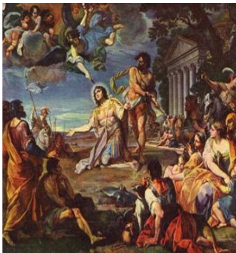
Placido Costanzi, Martirio di San Torpè, olio su tela, 1761, Pisa, cattedrale

L'origine della Chiesa pisana, al pari di altre Chiese locali, si confonde con antiche tradizioni agiografiche, nate per lo più in periodo medievale. Le due tradizioni che riguardano Pisa rimandano all'età apostolica e si riferiscono rispettivamente al presunto sbarco di san Pietro sul litorale pisano e Torpè, un soldato dell'«officium Neronis», che nella