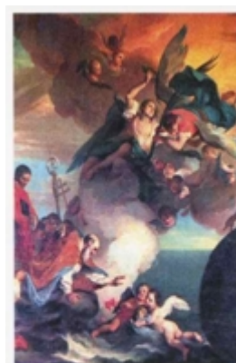
LA TESTA DI S. TORPÈ MARTIRE VIENE RECUPERATA DAL MARE PER MANO DEGLI ANGELI