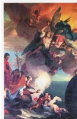
LA TESTA DI S. TORPÉ MARTIRE VIENE RECUPERATA DAL MARE PER MANO DEGLI ANGELI